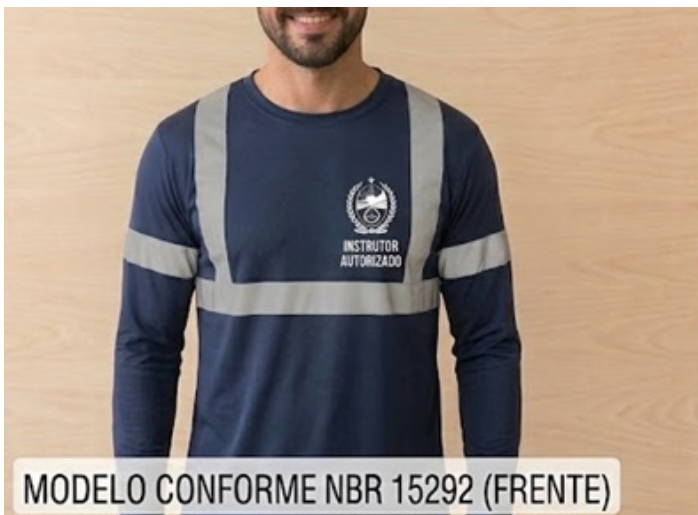
MODELO CONFORME NBR 15292 (FRENTE)