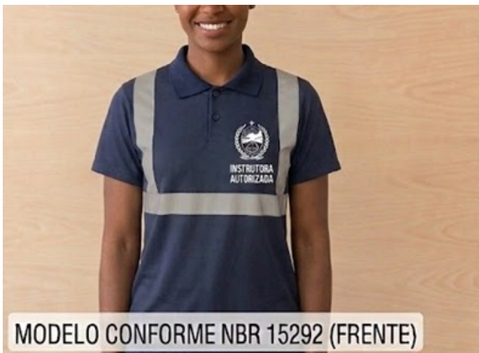
MODELO CONFORME NBR 15292 (FRENTE)