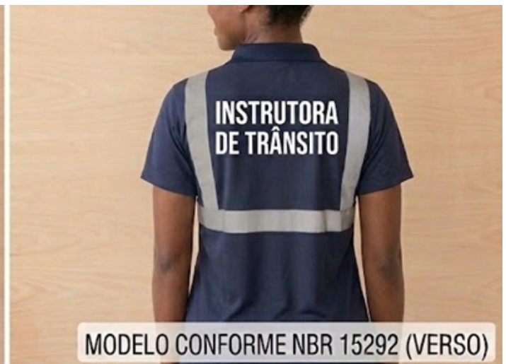
MODELO CONFORME NBR 15292 (VERSO)