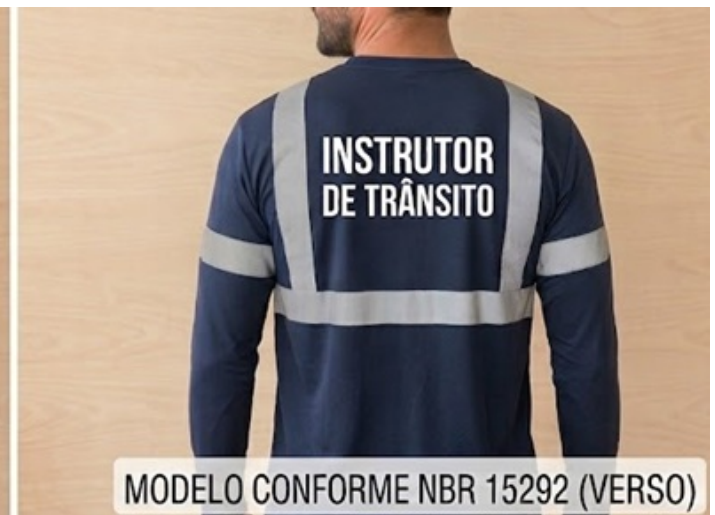
MODELO CONFORME NBR 15292 (VERSO)